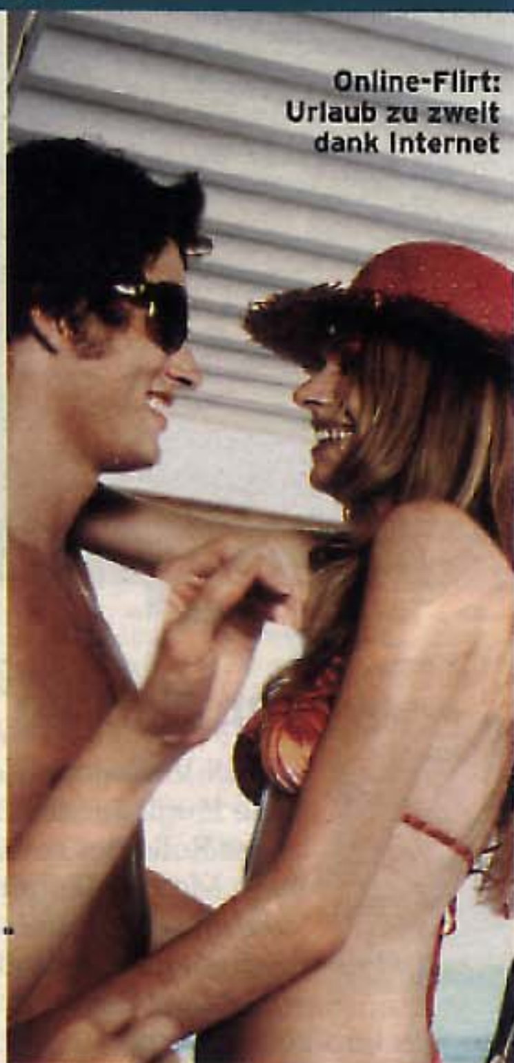
Online-Flirt: Urlaub zu zweit dank Internet

So tummelt sich in den Datenbanken von Anbietern wie Friendscout 24 oder Dating Cafe ein illustrer Querschnitt der Bevölkerung von 18 bis 80: Angestellte oder Freiberufler, eingeschworene Junggesellen oder Heiratswütige. Die Anmeldung ist in der Regel kinderleicht: Profil ausfüllen, Interessen benennen, ein wenig Eigenwerbung betreiben und ein aktuelles Foto hochladen. Dann heißt es: entweder warten, bis jemand anbeißt und schreibt – oder selbst mit Hilfe von raffinierten Suchprogrammen nach dem Traumpartner fahnden. Fast alle Anbieter verfügen über solche Matching-Systeme und informieren per Mail oder SMS über potenzielle Partner. Die meisten Dating-Sites haben einen kostenfrei nutzbaren und einen gebührenpflichtigen Bereich. Vorteil der Bezahl-Angebote: Die dort anzutreffenden Mitglieder meinen es ernster mit der Suche. Für 149