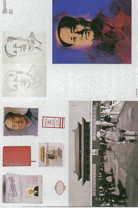
FOTOS: MEMENTOS AND DOCUMENTARY IMAGES TAKEN FROM WARHOL'S TRIP TO CHINA. MAO PAINTINGS AND DRAWINGS, 1972-73

ANDY WARHOL „GIANT SIZE“, PHAIDON VERLAG, BERLIN 2008, 420 X 320 MM, 624 SEITEN, 95 EURO